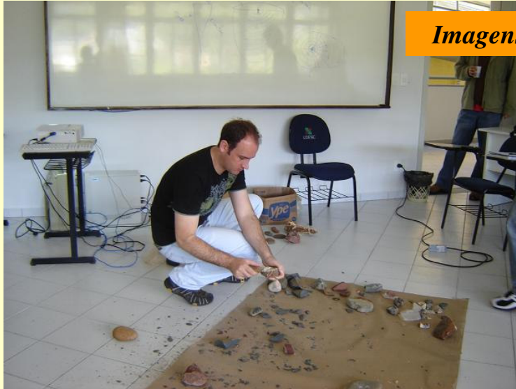
Imagens captadas nas oficinas